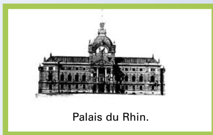
Palais du Rhin.

De CCR waakt van oudsher over de vrijheid en veiligheid van de vaart in het Rijnstroomgebied, maar houdt zich o.a. tevens bezig met de milieuaspecten die verbonden zijn met het vervoer over de Rijn. Zij heeft vanaf het begin ook nagedacht en gesproken over de bepalingen die zijn vastgelegd in het Scheepsafvalstoffenverdrag. De reden dat de (verdragsluitende) staten het Verdrag hebben gesloten en de bepalingen hebben vastgelegd in regelgeving, komt voort uit het besluit dat de bepalingen ook gelden op vaarwegen die niet onder het Rijnregime vallen.